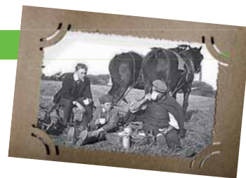
Een Ploughman's lunch, ca. 1880.

De Ploughman's lunch is een begrip in Engeland. In vrijwel elke pub kan men 'a ploughman's' bestellen. Zo'n smakelijke dis bestaat dan meestal uit een stuk Cheddarkaas of Stilton, pickles, groene salade, boter en een knapperige homp brood. Vaak wordt daar nog bij geserveerd een halve groene appel, selderie, paté, aardappelchips en een half gekookt ei. Oorspronkelijk was de Plou-